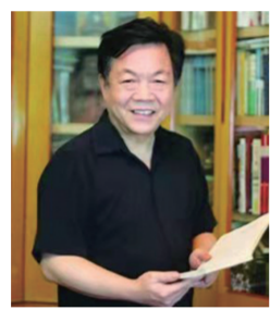
储福金(江苏省作协原副主席、著名作家)：

我们那一代作家的作品多是描写现实生活的。我曾经感恩，这一生经历过的酸甜苦辣的生活，生活中有过的痛苦与欣喜，有过的挣扎与奋进，有过的那种仿佛凝定的旧生活与变化发展的新生活。最近看了不少年轻作家的网络作品，让我感叹的是新一代作家的想象力，天上地下，过去未来，都在作品中得到丰富展现。想象力是文学创作的最重要的才能，天才的作家都表现了非凡的想象力。伟大作家无不表现着他生活的时代，期待年轻作家观察生活，品味生活，深入生活，体悟生活，再以丰富的想象力表现当今时代。